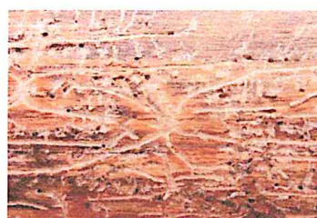
Fot. 2. Żerowisko z komorą godową