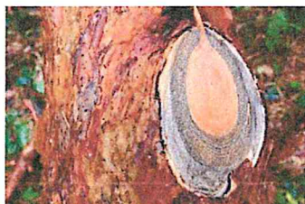
Fot. 4. Sinizna drewna