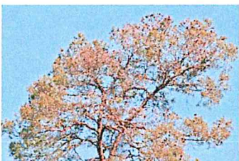
Fot. 3. Usychające igły w koronie sosny