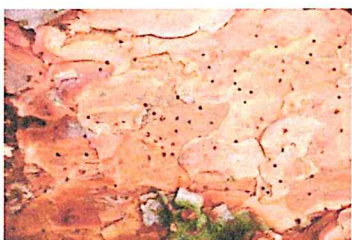
Fot. 1. Ślady zasiedlenia na korze