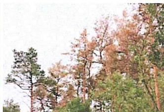
Fot. 5. Zasiedlane sosny zamierają